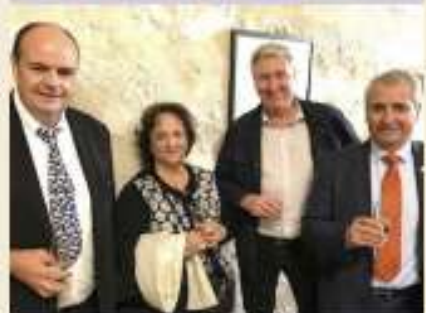
Schweiz, Israël und Frankreich