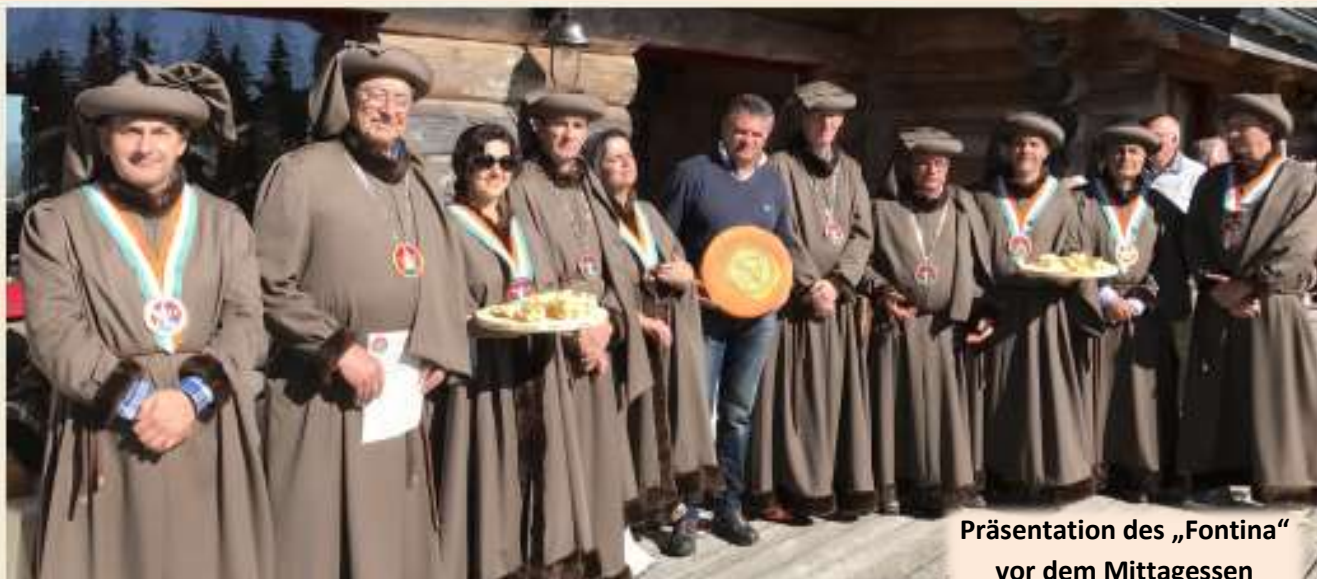
Präsentation des „Fontina“ vor dem Mittagessen

Guilde-Botschafter aus der ganzen Welt in Franche-Comté